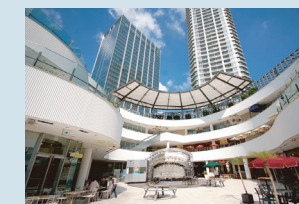
・横浜バイクォーター