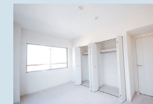
・大型クローゼット