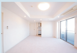
・リビングルーム