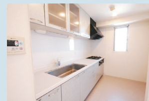
・システムキッチン